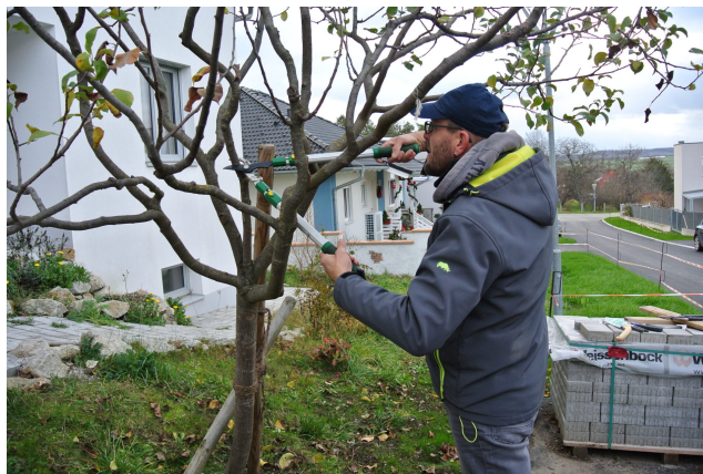
Maßnahme 4: „Streuobstwiesen“

Der nächste Obstbaum-Schnittkurs findet bereits am 28.1.2023 um 13 Uhr in Draßburg statt.